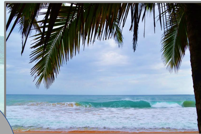
Beautiful Playa Bluff Nature Trail Ending

Price: $15 Guide: Luis Santos Duration: 2.5 hr Telephone: 6913-6402