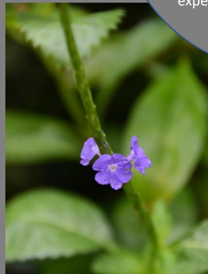
Traditional Ngöbe Plants