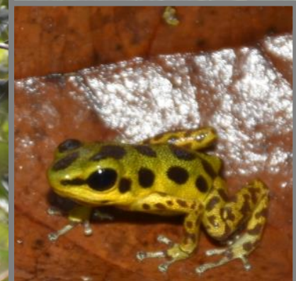
Poison Dart Frogs and Sloth Sightings